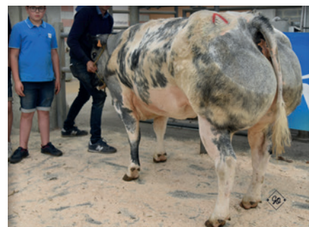
CHARMANTE de Renuamont