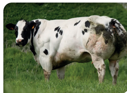
HISTORY de Mahoney grand-mère de / grootmoeder van AVICII

Indemne des tares connues Vrij van de gekende defecten